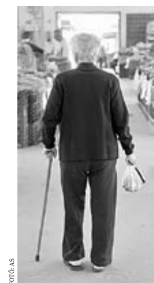
Stabil a nyugdíjfinanszírozás

A társadalombiztosítási alapok esetében a 2012-es költségvetési törvény eredetileg 5013 milliárd forintos bevételi és ugyanekkora kiadási előirányzattal számolt, az év során azonban ez utóbbit 5220 milliárd forintra növelték. Egy novemberi kormánydöntéssel 280-ról 297,5 milliárd forintra emelkedett a gyógyszerre, 43,3-ról 51,6 milliárd forintra a gyógyászati segédeszközök támogatási kerete. Ez volt az a két